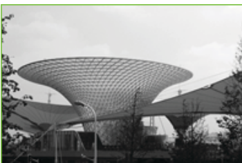
Centro de Exhibiciones